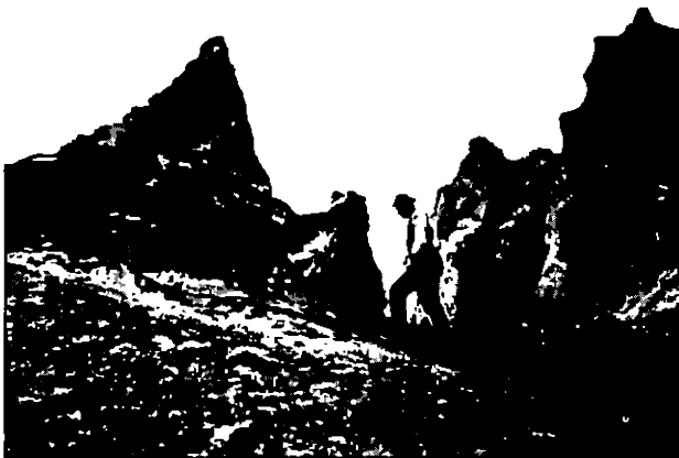
« Les plus grandes conquêtes du cinéma portent sur la durée... » (Le Camion, Marguerite Duras : Gérard Depardieu).